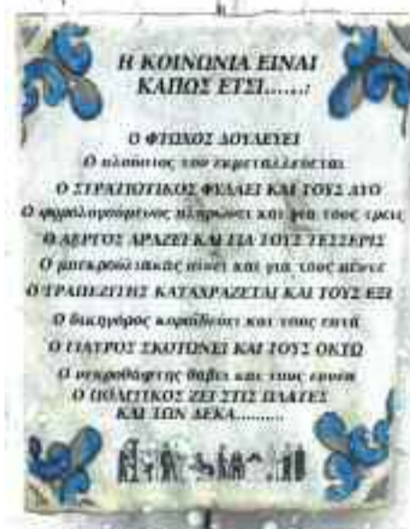
Η σχέση των κκ. Σαμαρά, Βενιζέλου και Κουβέλη ήδη δοκιμάζεται καθώς η συγκοίτηση απαιτεί συμβιβασμούς