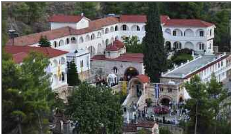
Η μονή του Οσίου Θεοδοσίου

Συναδέλφισσες-Συνάδελφοι, Μετά τις συγχωνεύσεις που έγιναν